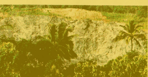
The Kerala High Court flays the State government for not addressing the environmental issues highlighted by the Palakkad District Collector in his report. A quarry at Muthalamada, near Palakkad.

KOCHI: The Kerala High Court on Friday ordered stopping of all quarrying and mining operations being carried out without environmental clearance in the Muthalamada I and II villages in Palakkad district which have been declared ecologically sensitive areas.